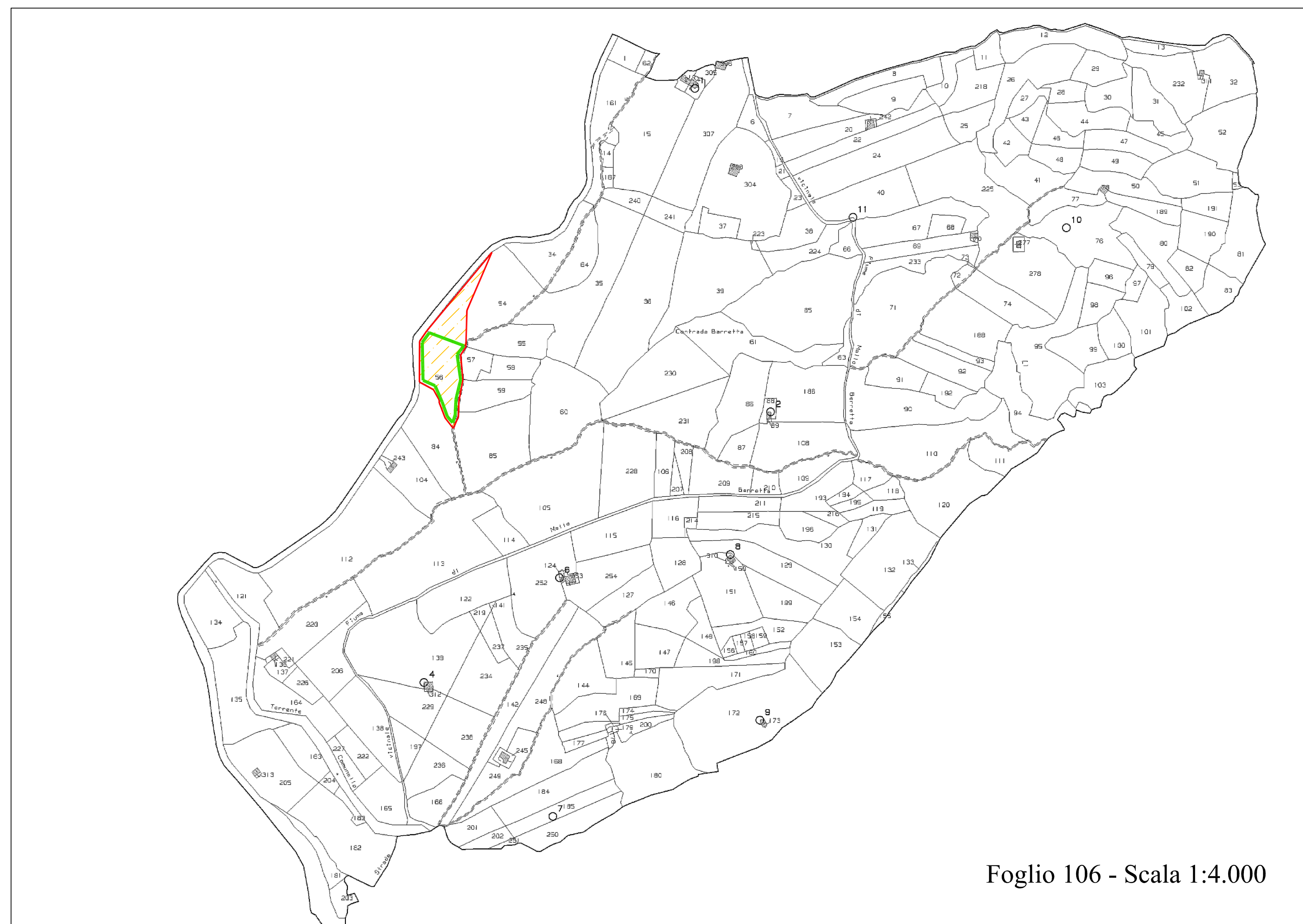
Foglio 106 - Scala 1:4.000